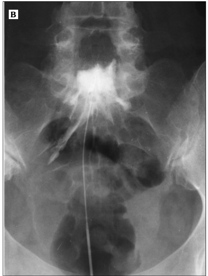
Εικόνα 1. Επισκληριδιόγραμμα. A. Διακρίνεται ο καθετήρας Racz που κάμπτεται συναντώντας συμφύσεις. B. Το σκιαγραφικό υλικό εξαπλώνεται στην αριστερή πλευρά χαμηλότερα από τον Ο5 σκιαγραφώντας ιερές ρίζες, ενώ δεν σκιαγραφείται η αντίστοιχη δεξιά περιοχή του επισκληριδίου χώρου όπου υπάρχουν συμφύσεις.

πισκληρίδιο χώρο άνωθεν της περιοχής της βλάβης, τότε το υγρό θα ακολουθήσει την οδό με τις μικρότερες αντιστάσεις, δηλαδή τη θωρακική, και όχι την οδό με τις υψηλές αντιστάσεις λόγω των συμφύσεων. Αυτός είναι και ο λόγος που σε συμφύσεις οσφυϊκής μοίρας χρησιμοποιείται ο ιερός επισκληρίδιος. Έτσι το χορηγούμενο υγρό υποχρεώνεται να περάσει από την οσφυϊκή μοίρα λόγω του ανένδοτου τοιχώματος του ιερού επισκληριδίου χώρου.