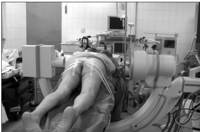
Εικόνα 2. Τοποθέτηση ασθενούς για συμφυσιόλυση (πρηνής θέση με ανασκωμένη τη λεκάνη).